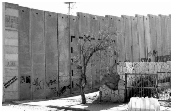
Photo : Mur de séparation construit par Israël à l'entrée de Bethléem. Vue côté palestinien, août 2005