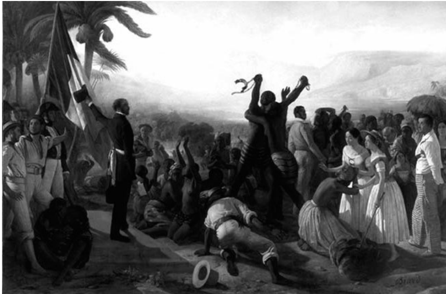
Image ci-dessus : François Auguste Biard, Abolition de l'esclavage , 1849