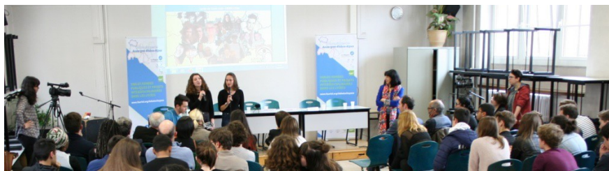
Création musicale sur « l'identité migratoire » (lycée de Saint-Just, 69)