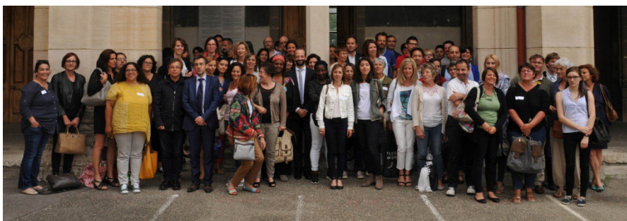
Les équipes et partenaires de la 5 e édition réunies en formation au lycée de Saint-Just (Lyon) le 30 juin 2017