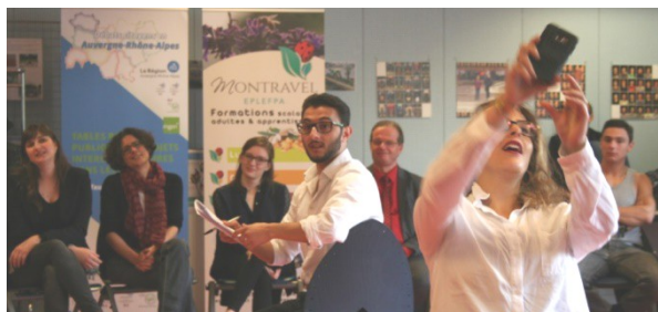
Interlude d'impro sur « l'engagement citoyen » (lycée horticole de Montravel, 42)

► Les Débats citoyens sont reconnus parmi les huit « expériences innovantes d'éducation à la citoyenneté » ( Rapport du Cnesco 6 , avril 2016) et parmi les initiatives pour « réinventer l'école » en France ( Dossiers d'Alternatives économiques , décembre 2016). L'expérimentation « Debate Study » est le projet lauréat de l'académie de Lyon pour la Journée nationale de l'innovation (Paris, 29 mars 2017).