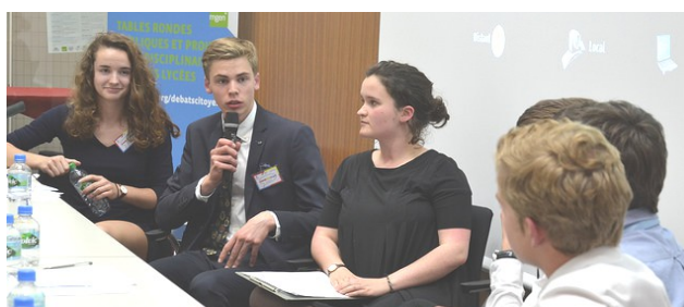
Débat entre lycéens : « AURA : une Région d'avenir ? » (Lycée Massillon, 63)

► Parole d'expert : « Les Débats citoyens ont valeur d'exemple. Ils démontrent comment s'affirme dans la République un pouvoir d'invention et d'expression d'elle-même, condition de son avenir, de sa capacité à "faire société". À se démocratiser en d'autres termes. Ce pouvoir est intimement lié à l'école, à cet univers qui doit lui aussi se réinventer en permanence, se rendre capable de s'ouvrir à l'universalité du monde comme à la personnalité de chaque élève » (Vincent Duclert, historien, inspecteur général de l'Éducation nationale, préface 2015).